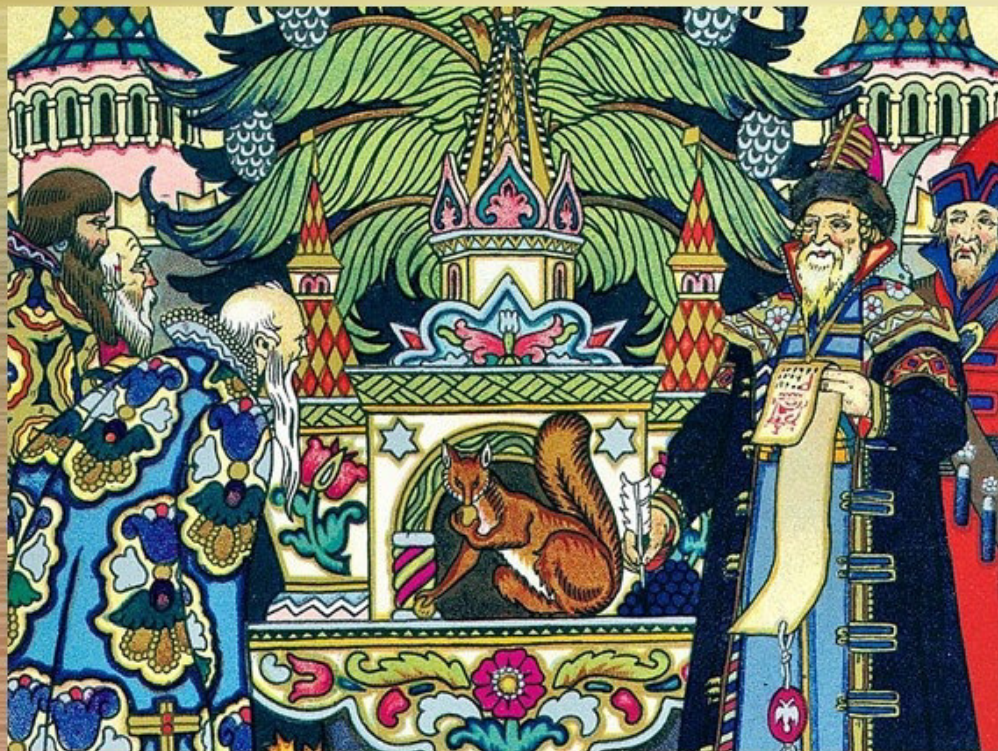
Иллюстрация к сказке А.С.Пушкина «Сказка о царе Салтане» «После возвращения в свои владения Гвидон рассказывает лебеди о белке, и та переселяет её в его город. Для белки князь строит хрустальный дом».