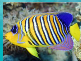
Рыба - ангел